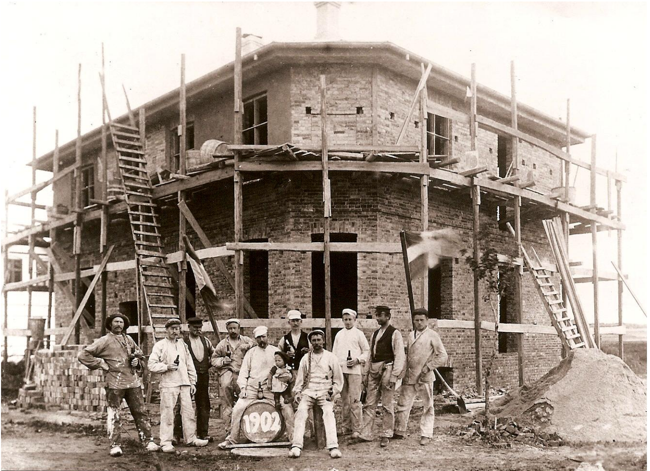
Forfatterens morfar som nr. 4 fra højre under opførelse i 1902 af en endnu eksisterende ejendom – oprindeligt som købmandsbutik – på hjørnet af gaderne Frem og Peter Rørdamsvej i Lyngby.